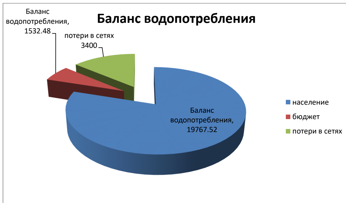
Рисунок 2.2.5.1- Структурный баланс водопотребления по группам потребителей