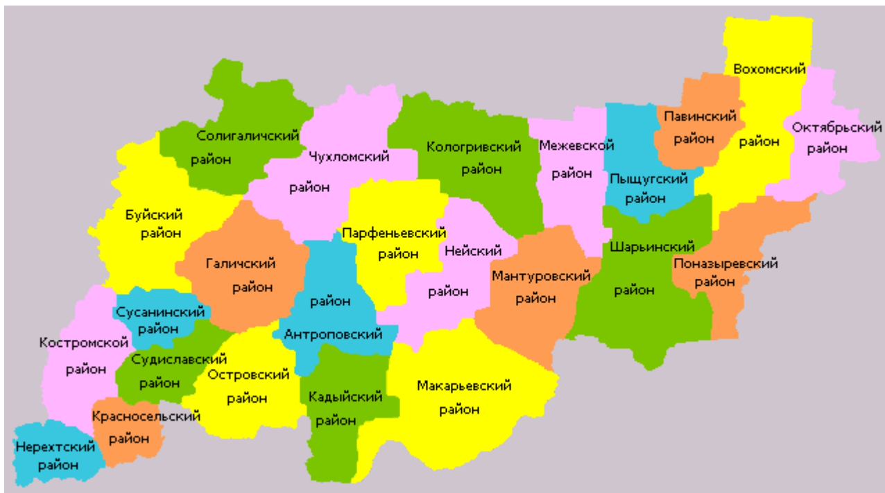
Рисунок 1.1.1 – Расположение Макарьевского муниципального района на карте Костромской области