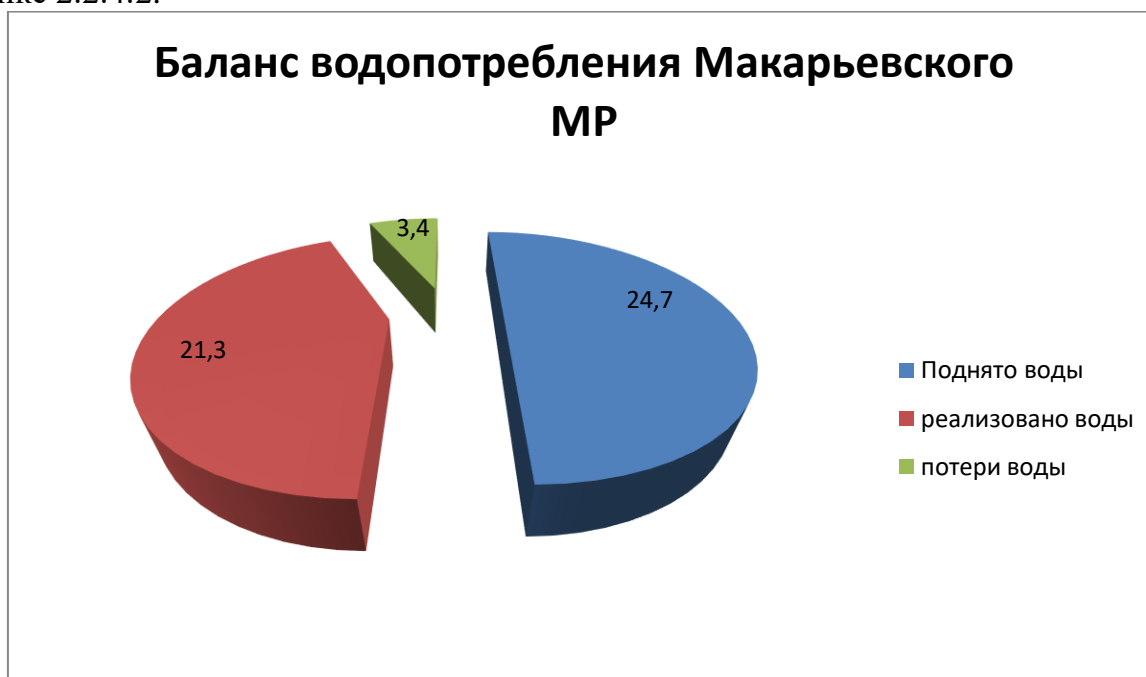
Рисунок 2.2.4.2 - Общий баланс водопотребления сельских поселений Макарьевского МР

Баланс водопотребления сельскими поселениями Макарьевского МР представлен на рисунке 2.2.4.2.