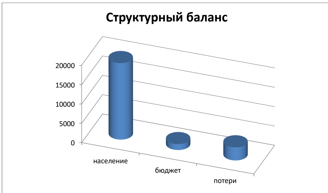
Рис. 2.1.4.2.3 Расход воды по группам потребителей